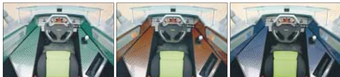
Farbenspiele: Je nach Gemütszustand der Fahrers wechselt die Farbe von Grün (neutral) über Orangegelb (stimulierend) bis Blauviolett (beruhigend). Möglich macht dies eine Spezialfolie.

Um das zu realisieren, erfährt der sensible Bolide die biometrischen Werte des Piloten und wirkt mittels Mustern, Farben, Musik, Düften, ja sogar haptisch auf ihn ein. Und das geht so: Eine biometrische Uhr misst die Pulsfrequenz des