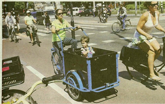
Früher nutzten holländische Fleischer und Bäcker die Transportfahräder zu Auslieferung ihrer Ware – jetzt haben Eltern, wie diese Mutter in Amsterdam, die Gefährte wiederentdeckt. Holland gehört zu den kinderfreundlichsten Ländern.

Die Geburtenrate liegt in Holland bei 1,66 Kindern pro Frau und damit deutlich über der in Deutschland (1,35).